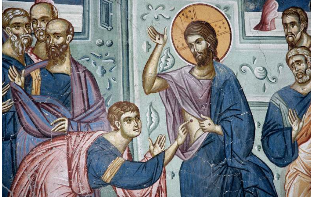
Уверение апостола Фомы