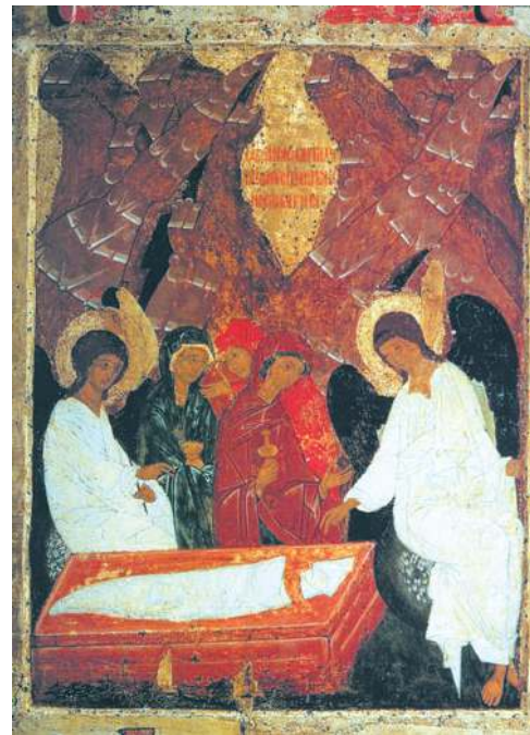
Мироносицы у Гроба

Раскопки, производимые в Иерусалиме, позволили обнаружить ряд подтверждений евангельской истории. Так, еще в XIX столетии была найдена купальня Вифезда, о которой идет речь в Евангелии от Иоанна (см. Ин 5:2). В 1961 году в